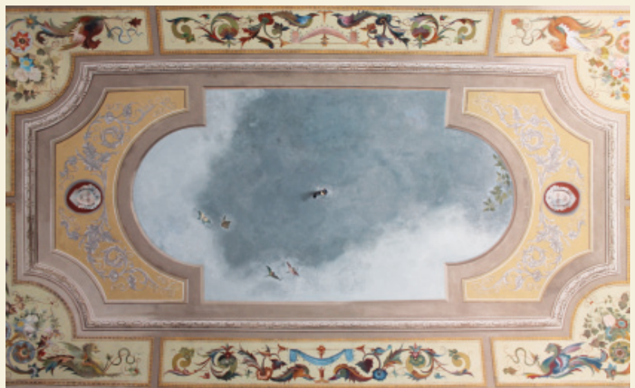
Il soffitto di una delle sale da Pranzo.

Se crescesse di più l'idea di patrimonio culturale lieviterebbe il senso di responsabilità comune, il senso di tutela utile alla testimonianza futura di questa preziosa stratificazione culturale; una stratificazione che nella logica contemporanea non deve entrare in attrito, anzitutto per il Bene dei propri Figli. ■