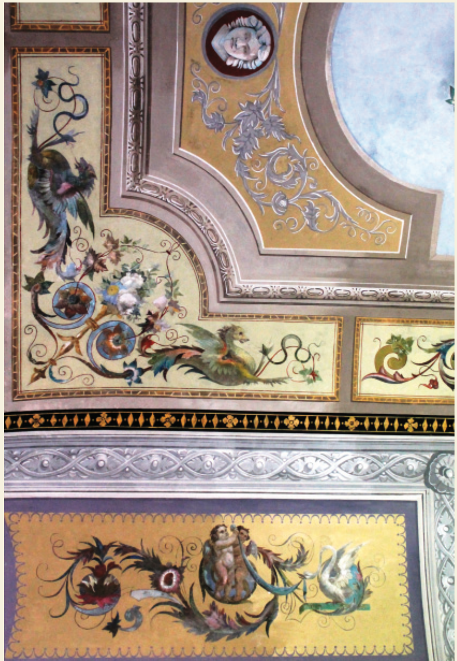
Scorcio del soffitto di una delle Camere da Letto, figure apotropaiche ed oniriche, tratte dalla mitologia greco locale.