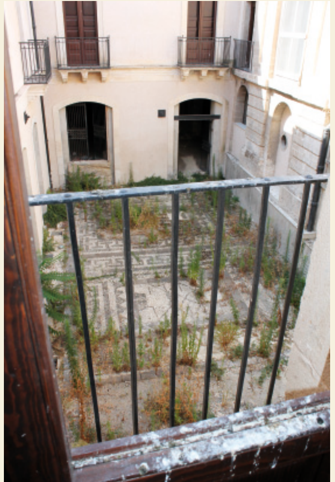
Cortile con Mosaico di fine ottocento pre restauro.

spontaneo forse interrogarsi su quanta "luce" sia stata fatta entrare ad oggi su questa importante dimora storica. Qui, senza esclusioni di colpi, ricostruiamo i precedenti: dai registi storici , i Beneventano fanno apparizione per la prima volta a Lentini nel 1292, dove con