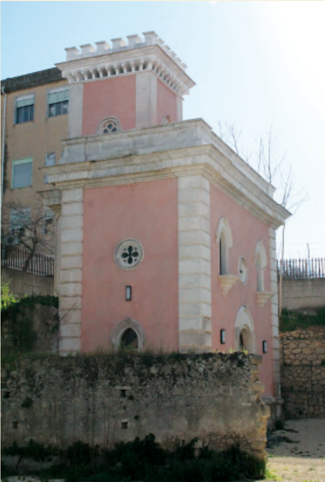
L'osservatorio post restauro.