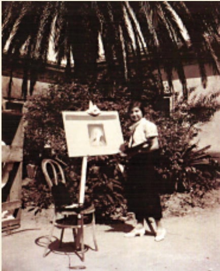
Un aerede che dipinge presso il cortile dell'Osservatorio, con a sx la statua commissionata in onore a Don Peppino Beneventano – Senatore del Regno d'Italia – oggi sita presso Villa Gorgia.

del Teatro Massimo di Catania (1870). La costruzione a Lentini, però, non seguì del tutto il progetto del Sada e durante i lavori, che si protrassero per decenni, subì notevoli interruzioni e variazioni. Erano gli anni in cui don Luigi Giuseppe Beneventano divenne Sindaco di Lentini e Senatore monarchico del Regno d'Italia, fu con lui che i Beneventano subirono la variazione del privilegio da "del Bosco" a "della Corte". Morì il 24 Marzo 1934 lasciando in eredità la proprietà a Lucrezia Beneventano Geronimo, Concettina Beneventano Geronimo e Francesco Di Paola.