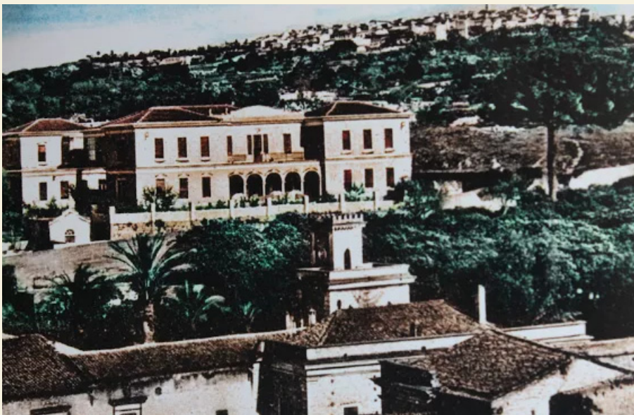
Panoramica "a volo d'uccello" del Palazzo Beneventano e dell'Ospedale Civile – anni '40.