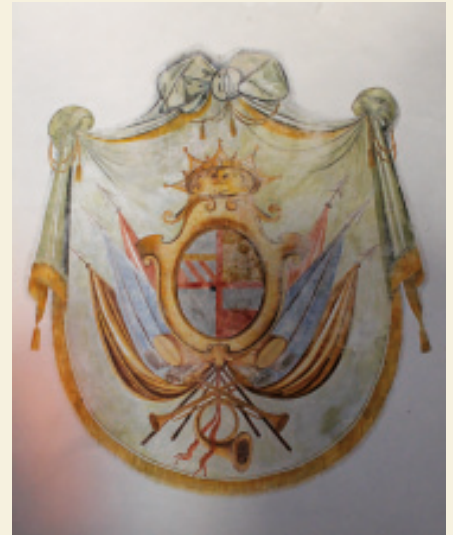
Stemma della famiglia nella Sala del Trono – ricevimento del Barone.

Oggi, 2016, questo Patrimonio attende la consegna dei lavori dei restauri di tipo conservativo e in parte ricostruttivo ; la dimensione del complesso edilizio, la sua articolazione in corpi, le differenti caratteristiche spaziali dei vari ambienti che li costituiscono, suggeriscono destinazioni d'uso anch'esse differenziate ma suscettibili di una gestione relativamente unitaria. L'utilizzazione che sembra più consona all'edificio è quella di polo culturale. In