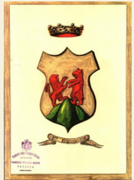
Antico stemma Gentilizio di Casa Beneventano baroni della Corte, signori di Montone.

Palazzo Beneventano occupa, rispetto al centro storico di Lentini, una posizione di particolare rilievo, una cerniera posta tra l'abitato e una vasta zona detta "Sibba" – o Selva – già Colle Sant'Eligio, noto per la sua necropoli greca arcaica [Leontinoi]. Questa posizione trova espressione architettonica nel "cannocchiale prospettico", coincidente con il percorso composto da tratti urbani lungo Via San Francesco d'Assisi . Varcato l'uscio di sinistra, uno dei due portoni principali, e superato un breve atrio con un continuo del prezioso prospetto principale, si entra in cortile, nel quale sono evidenti i segni del processo di regolarizzazione nella coppia di corpi edilizi che delimitano il passaggio verso il parco [*Sibba].