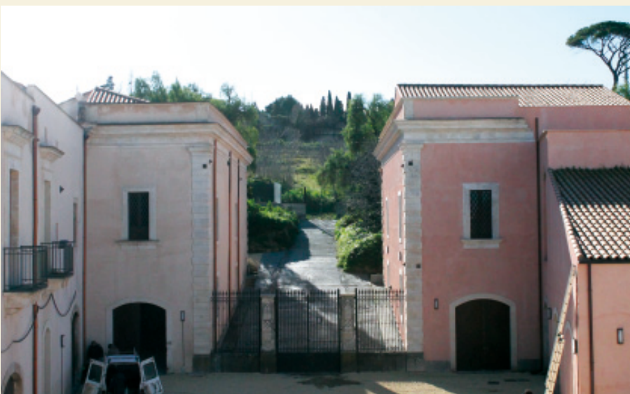
Prospetto del cortile interno, versante Sud, con cancello che conduce al Parco detto "Sibba".

1910, Giuseppe Luigi IV (Don Peppino) fa costruire, accanto al palazzo esistente, un altro edificio che con il primo costituisce il prospetto principale, anch'esso mai ultimato per motivi finanziari. È in questa fase che lavorarono per i Beneventano diverse maestranze di spicco, maniscalchi, pittori, con la supervisione del vulcanico Architetto Carlo Sada, già noto in quel tempo per aver collaborato alla nuova progettazione